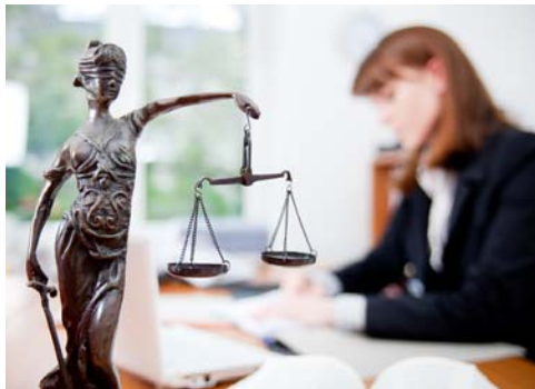
Rechtsinformationen im Netz bietet das Justizportal.

https://e-justice.europa.eu/home.do > Europäisches Justizportal