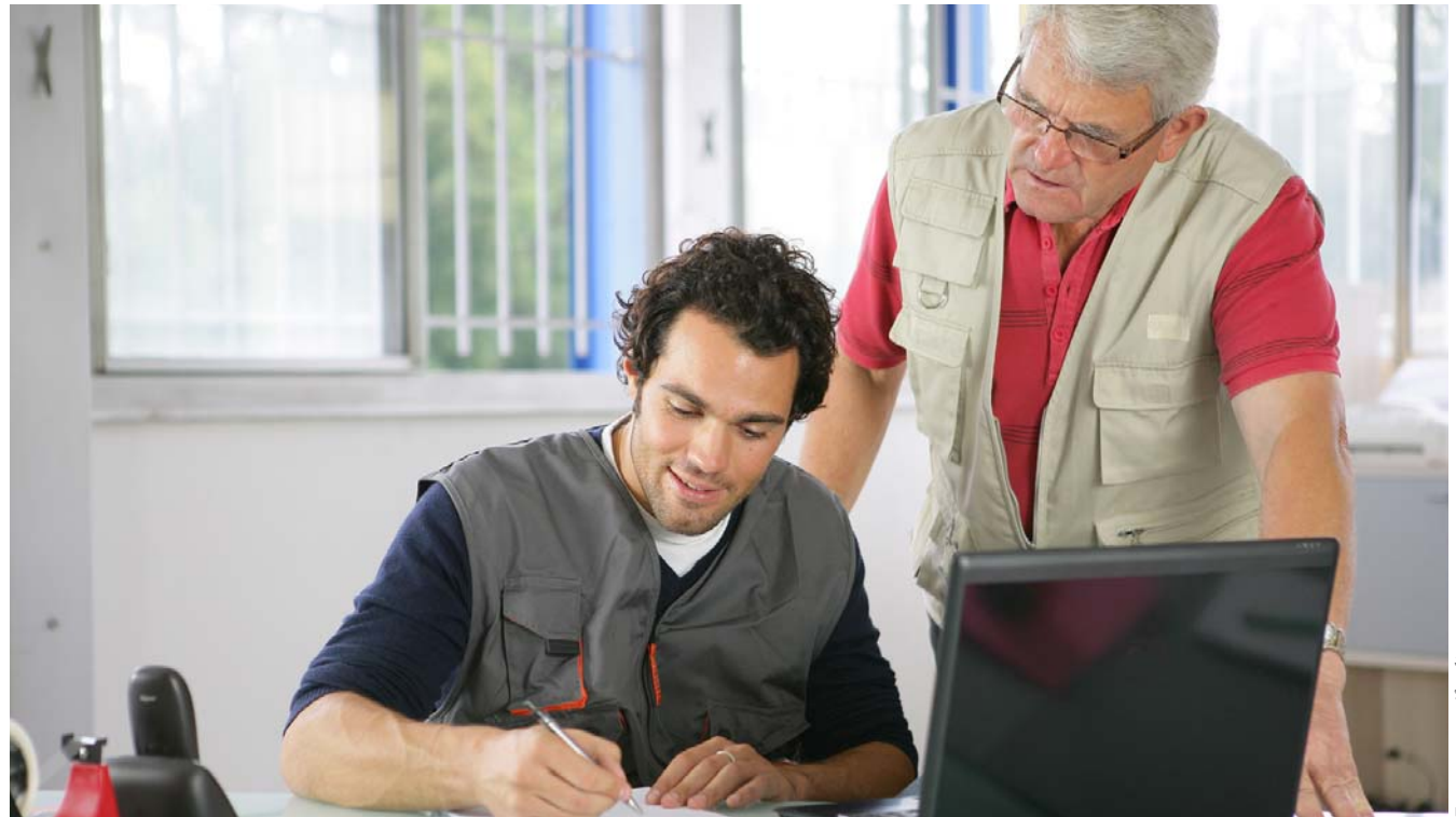
Jung und Alt profitieren vom Austausch.

Teilzeit, Gleitzeit, Schichtarbeit oder Altersteilzeit – der Arbeitgeber kann die Arbeitszeiten an die Lebensphasen und Bedürfnisse (Elternzeit, Wiedereinstieg) seiner Mitarbeiter anpassen. Mehrarbeit, Überstunden und Nachtschichten machen vor allem Älteren zu schaffen und sollten begrenzt werden. Die Verantwortung für einen gesunden Lebensstil trägt der Mitarbeiter natürlich selbst. Unternehmen können allerdings Denkanstöße geben – für gesunde Ernährung, Rauchentwöhnung oder einen kontrollierten Umgang mit Alkohol.